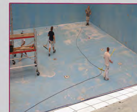
Reinigen / Nettoyant