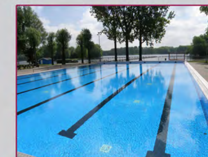
Het eindresultaat / Le résultat final