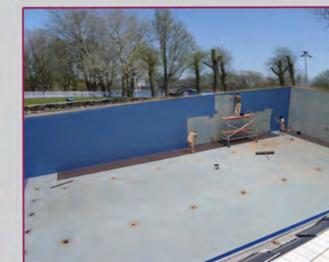
Rollen / Rouleau