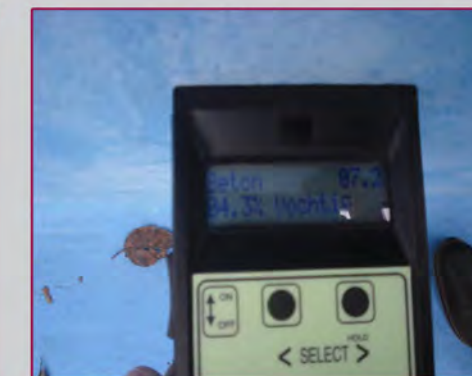
Vochtpercentage meten / Mesure du contenu en eau