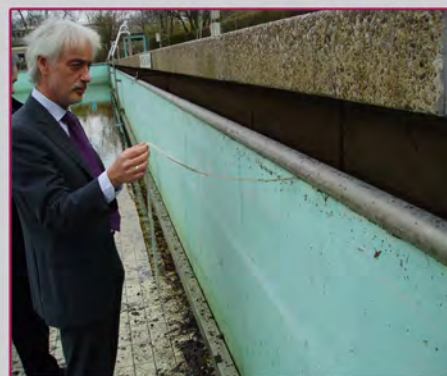
Testen / essai