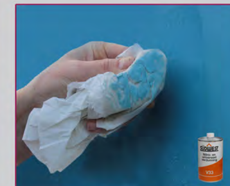
Ondergrond controle / inspection de surface