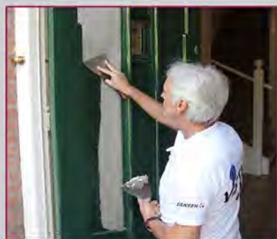
Super glad resultaat